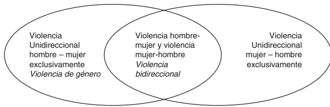
Figura 1. Violencia de pareja en relaciones heterosexuales en función de la dirección de la violencia perpetrada.

Estas conductas pueden producirse en un contexto de conflicto en la relación de pareja y también durante la ruptura de la pareja y después de la misma (Johnson, 2011). La violencia física leve y la violencia psicológica son las que mayor prevalencia tienen (Muñoz y Echeburúa, 2016).