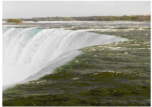
Fig. 1. Les chutes du Niagara. Métaphore de l'expression « être au bord ».

Les images évoquées par « être au bord » peuvent être les chutes du Niagara (Fig. 1) ou la marche solitaire sur le bord en haut d'une falaise (Fig. 2). Une autre image pourrait être la Création d'Adam par Michel-Ange (Fig. 3) : un bord entre les deux figures d'Adam et de Dieu. Une autre représentation du bord peut être vue dans la scène puissante du film Rebel without a cause [3] où deux jeunes font une course avec des autos volées vers le bord d'une falaise et où l'un d'eux fait une chute catastrophique par-dessus le bord.