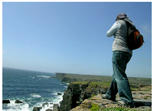
Fig. 2. Marche solitaire sur le bord d'une falaise. Autre métaphore pour désigner « être au bord ».

Ces images peuvent susciter une constellation de sentiments éprouvés par ceux qui se perçoivent émotionnellement sur le bord, sur le fil du rasoir. C'est souvent l'expérience d'être à la frontière entre la vie et la mort, d'être à haut risque quant à la survie physique et psychique.